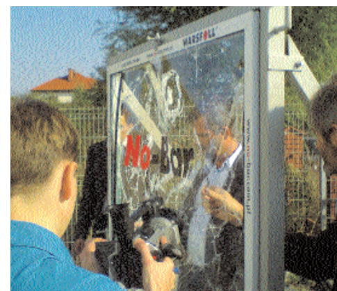
Fot. 2. Szyba po ataku popękana, lecz w dalszym ciągu chroni okno